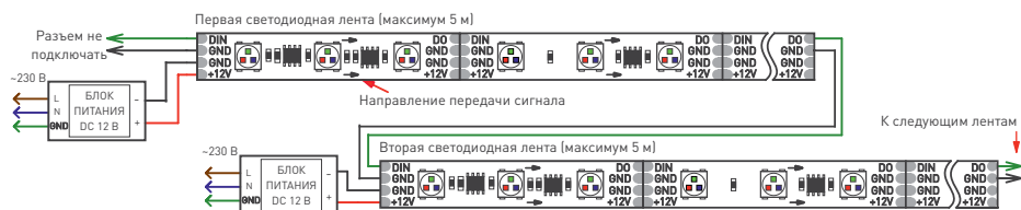
Рис. 1. Схема подключения ленты без использования внешнего контроллера (максимум 1024 пикселя, общий рисунок динамического эффекта при переходе с ленты на ленту сохраняется)