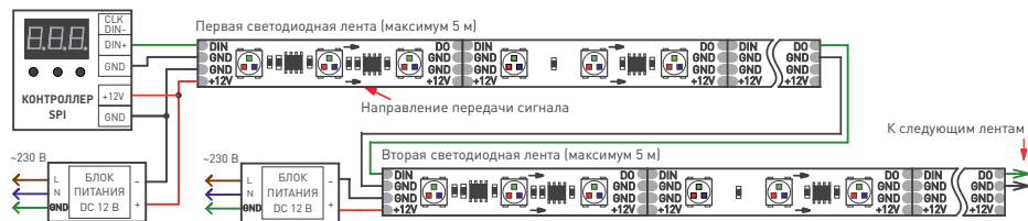
Рис. 2. Схема подключения ленты при управлении от внешнего контроллера