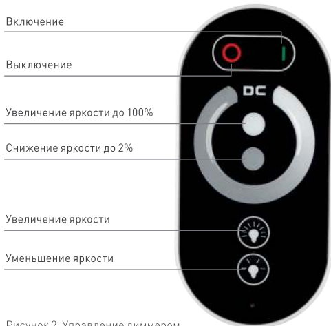
Рисунок 2. Управление диммером.

Примечание. При привязке нового пульта, удаляется предыдущий. Поддерживает управление только 1 пультом.