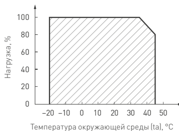
Рисунок 2. Максимальная допустимая нагрузка, % от мощности источника