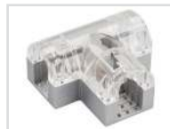
Соединитель тройной Арт. 022703 ARL-CLEAR-U15-2x90 (26x15mm)