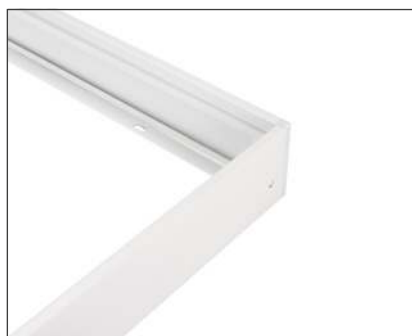
032970 Набор SX6060T White

Белая рамка для накладной установки панелей