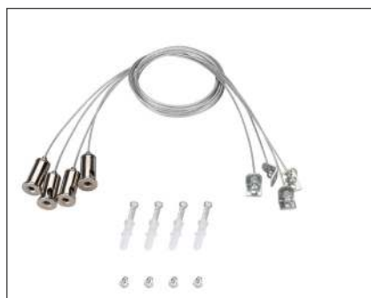
029583(1) Набор SPX-T4 для панелей 600x600

Белая рамка для накладной установки панелей