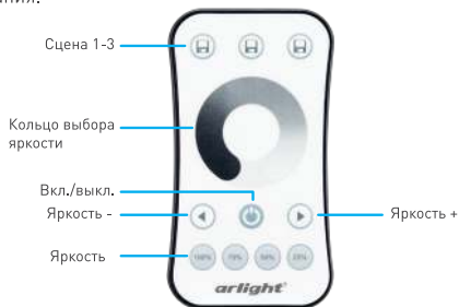
Рисунок 2. Назначение кнопок на пульте управления