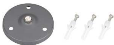
Рисунок 2. Основание для установки на поверхность (арт. 024890)