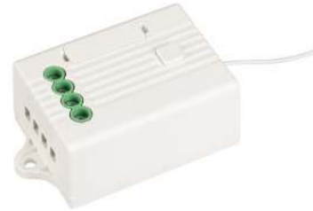
РЕЛЕЙНЫЙ МОДУЛЬ TUVA-701-WF-SUF Арт. 036221

Примечание. Подробное руководство к программному обеспечению смотрите на сайте artlight.ru .