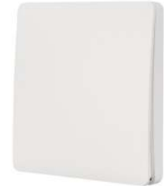
ПАНЕЛЬ TUVA-228-1-RF-SUF Арт. 033667