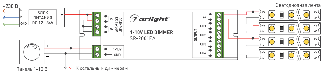
Рис. 2. Схема подключения SR-2001EA.