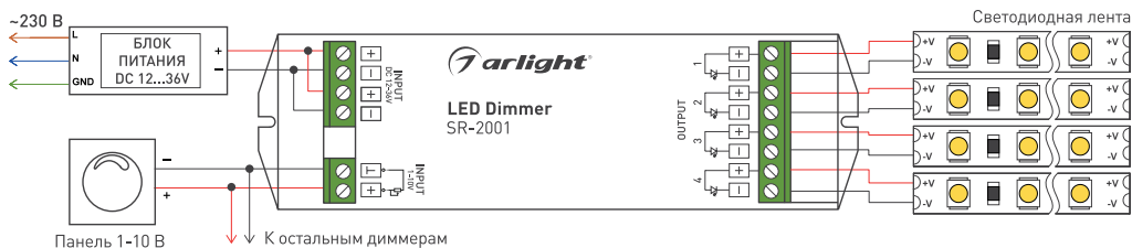
Рис. 1. Схема подключения SR-2001.